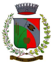
NAVE SAN ROCCO