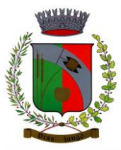
NAVE SAN ROCCO