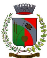
NAVE SAN ROCCO

Via Diaz, 26 – 38023 Cles (TN) Tel. 0463. 600113 – Fax 0463.600113 - Cell.: 338-8367437 e-mail: cristina@studiocamanini.it - pec: cristina.camanini@pec.odctrento.it