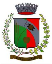
NAVE SAN ROCCO