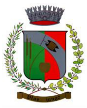
NAVE SAN ROCCO